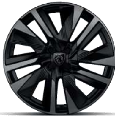
Jantes alliage 18" diamantées EVISSA bi-tons Noir Onyx, vernis Black Mist avec inserts Noir Onyx mat

De série sur ALLURE, GT En option sur BUSINESS (Sauf si Pneumatiques All Seasons))