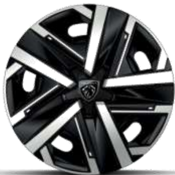
Jantes tôle 16" avec enjoliveurs SILOM Gris Eclat & Noir Orbitat, vernis mat