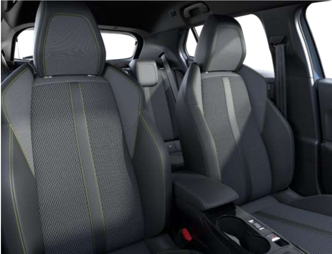
Sellerie tissu BELOMKA, accompagnement TEP Isabella, trimatière Uni Capy et surpiqûres Vert Adamite ATFX De série sur GT