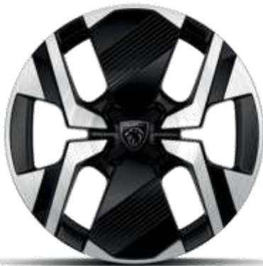
Jantes alliage 17" diamantées KARAKOY bi-tons Noir Onyx et vernis brillant

De série sur ALLURE, GT En option sur BUSINESS (Sauf si Pneumatiques All Seasons))