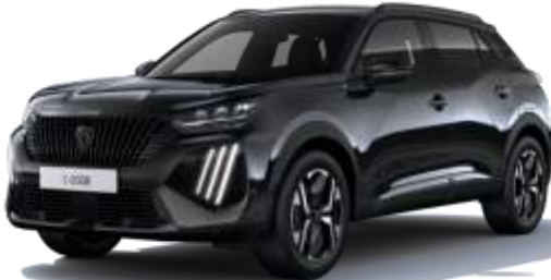
Noir Perla Nera

M0SU - Option Teinte gratuite sur STYLE et BUSINESS