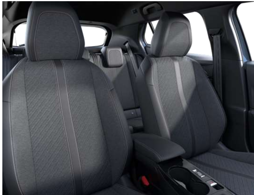
Sellerie tissu CASUAL LOMSA embossé, accompagnement TEP Isabella, tri-matière LOMSA et surpiqûres Quartz