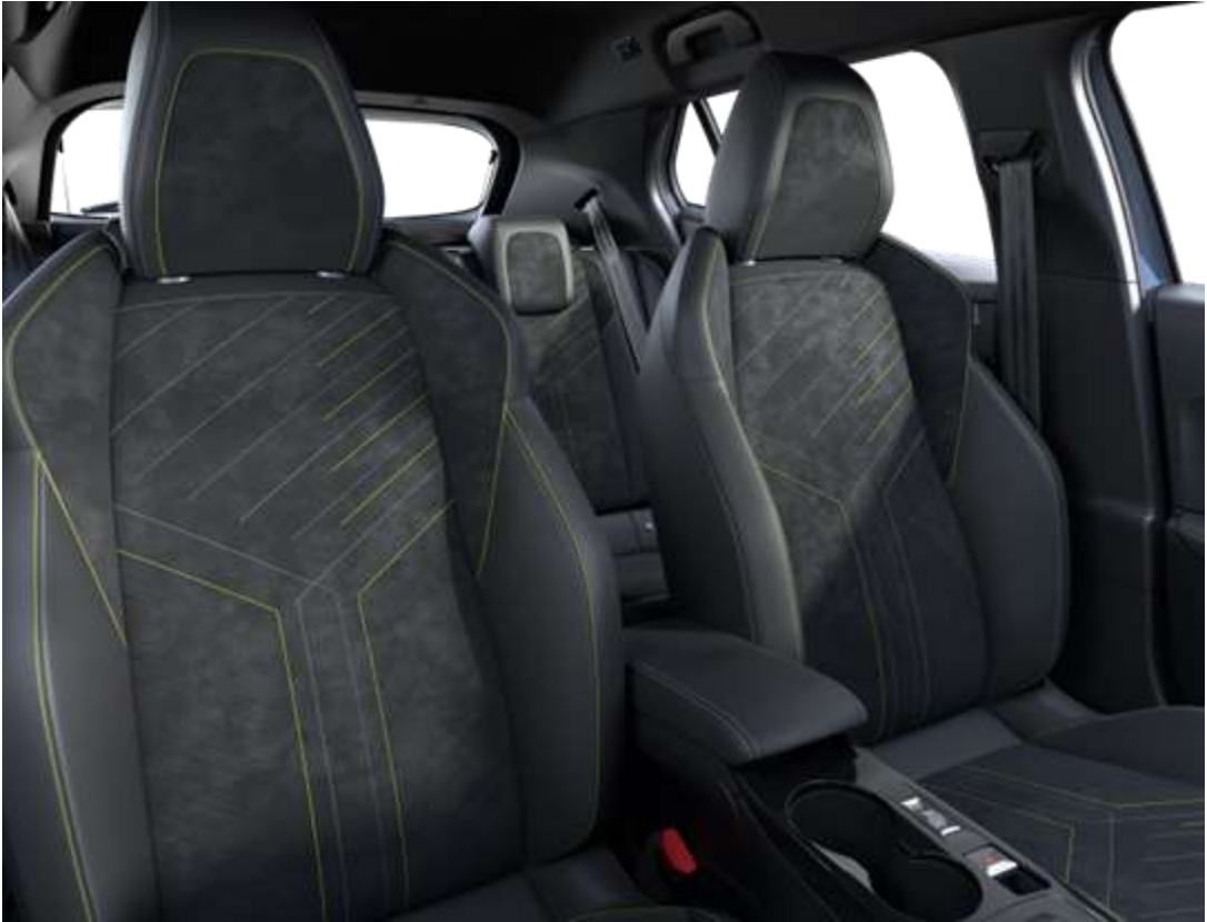
Sellerie Alcantara® Mistral ICONIUM accompagnement TEP Isabella, trimatière Alcantara Noir et surpiqûres Vert Adamite WNFX En option sur GT