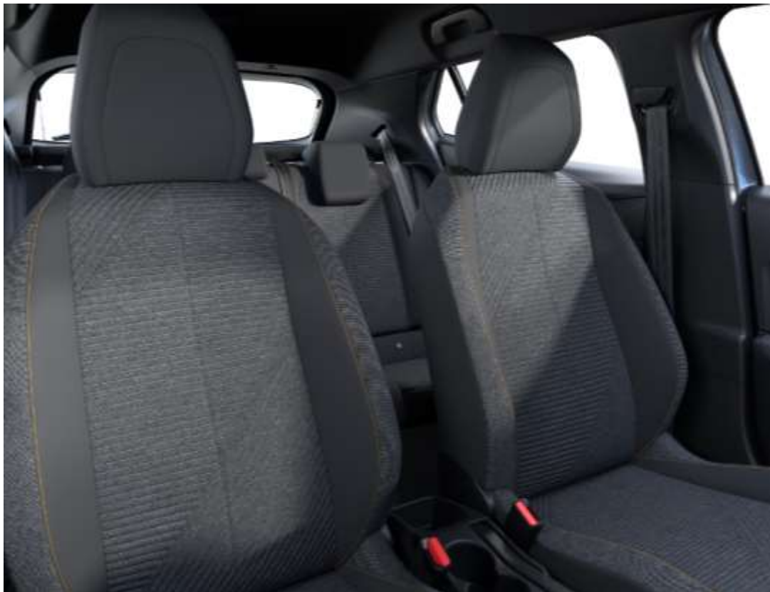
Sellerie tissu RENZO, accompagnement Rimini, surpiqûres Orange Sunrise