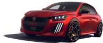
Rouge Elixir / Toit Noir Perla Nera M5VH – Option