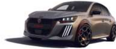
Gris Artense / Toit Noir Perla Nera M0F4 – Option