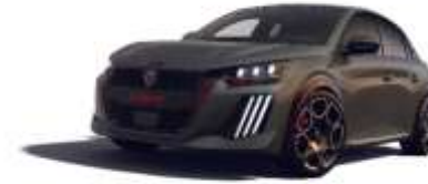
Gris Selenium / Toit Noir Perla Nera M0LD – Option