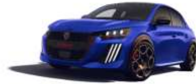
Bleu Miramar / Toit Noir Perla Nera M07T – Option