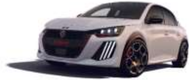
Blanc Okénite / Toit Noir Perla Nera M0SU – Teinte gratuite