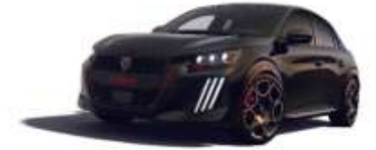
Noir Perla Nera M09V – Option