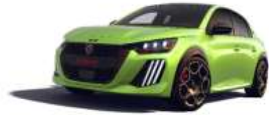
Jaune Agueda / Toit Noir Perla Nera M0EQ – Option